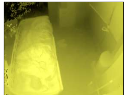
シルエットとは・・・「シルエット見守りセンサ」で映し出される見守り対象者のプライバシーに配慮した画像です。

赤外線を使用したシルエット見守りセンサ®は、居室に行かなくてもタブレット端末から患者様の様子をシルエット®で確認することができます。ベッドから起き上がる段階でお知らせが届くため転倒予防に役立ちます。