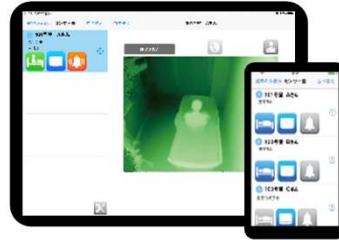
見守りモニタ(汎用タブレット端末)